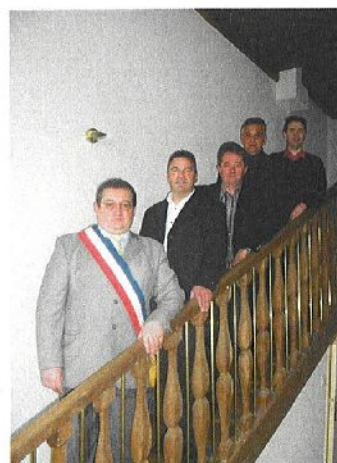
Le Maire et ses adjoints

Finances/Développement économique, Appel d'offres (titulaire)