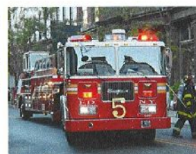
Nous n'en sommes pas encore là !!!

Le coût annuel payé par la commune s'élève à 19 572 €, venant en plus des dépenses engagées par le conseil général, qui supporte l'essentiel des dépenses.