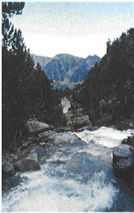
L'eau c'est la vie