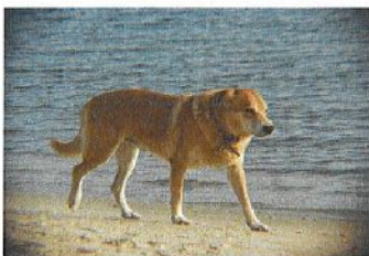
Le compagnon fidèle

Les chiens !!! Animaux de compagnie, ceux-ci peuvent causer des troubles à l'ordre public. Nous rappelons que la divagation des chiens est interdite (amende de 50 €). Quel plaisir de pouvoir se promener dans nos rues et chemins en toute tranquillité. Alors, on fait un effort pour le compagnon fidèle !!!