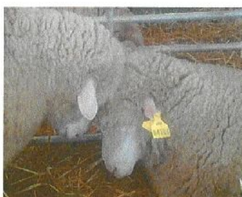
Ils sont heureux