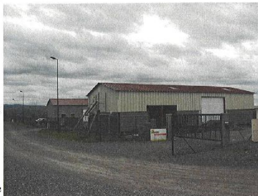
La Zone Artisanale

Pour plus d'informations, veuillez prendre contact avec le Maire.