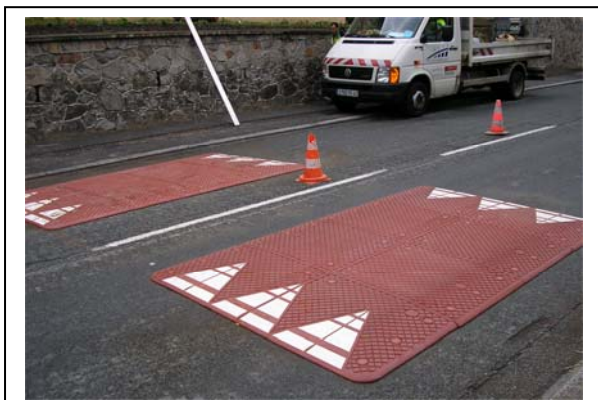
Pensez à ralentir !!!