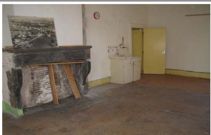
la salle de la MJC