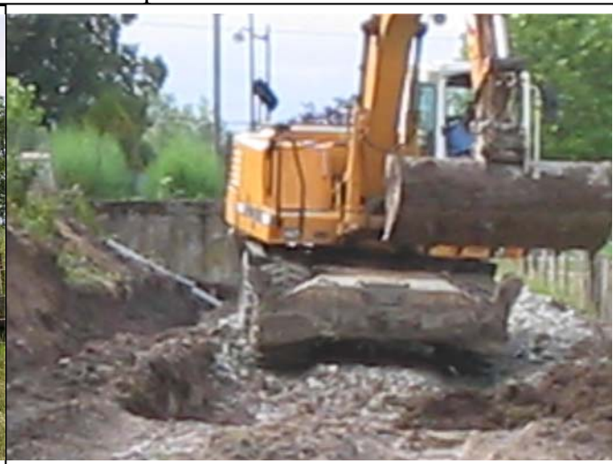
des moyens techniques spectaculaires