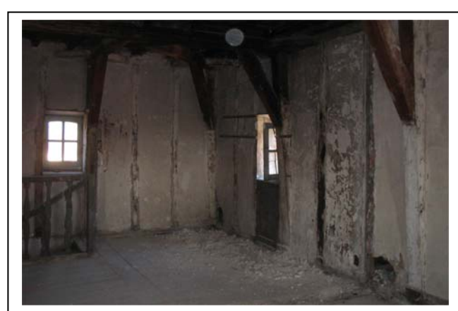
future salle de réunion des Associations