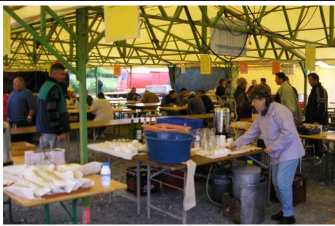
Les bénévoles en action