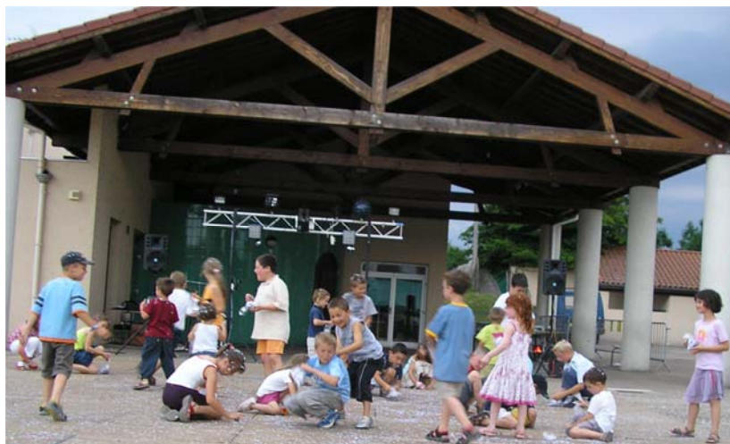
Une bataille de confettis mémorable

Un grand merci au SOU des écoles qui organise ces activités pour financer les activités culturelles de nos enfants.