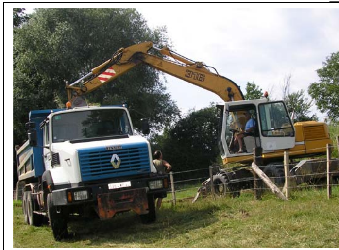
Pendant les travaux,