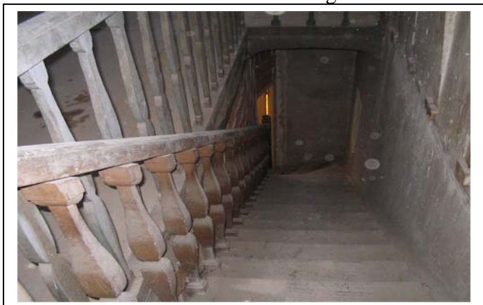
Montée vers le grenier