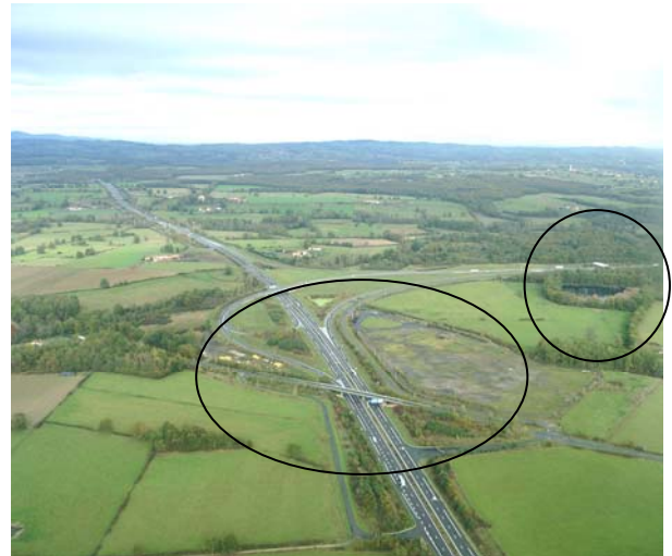
Asnière zone d'activité autoroute

Afin d'organiser la circulation des riverains et l'accès des nouveaux quartiers il sera nécessaire de réaliser de nouvelles voiries. Des emplacements réservés ont été déterminés afin de permettre ces aménagements.